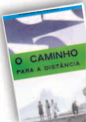
O CAMINHO PARA A DISTÂNCIA 112 páginas, R$ 32.