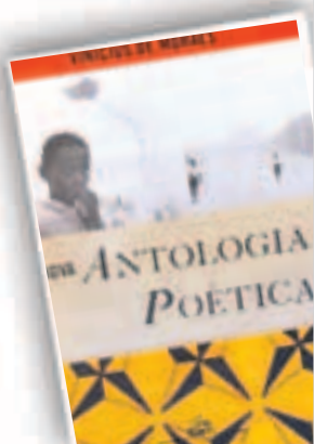
NOVA ANTOLOGIA POÉTICA 312 páginas, R$ 46.